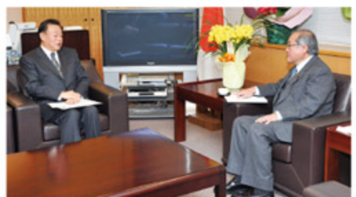
松下関経連副会長他との面会・副大臣室 (1月16日)