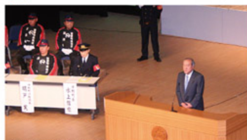
洋野町消防出初式 (1月6日)