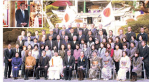
山田町二八会通暦祝いの会 (1月12日)