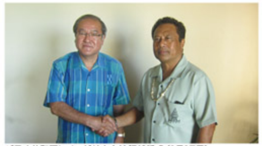
パラオ共和国レメンゲサウ大統領就任式 (1月17日)