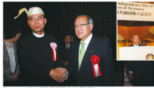
ミャンマー独立記念日祝賀会 (1月9日)