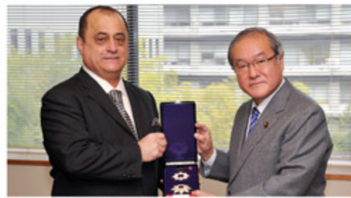
レバノン大使に対する献章伝達式・副大臣室 (1月10日)